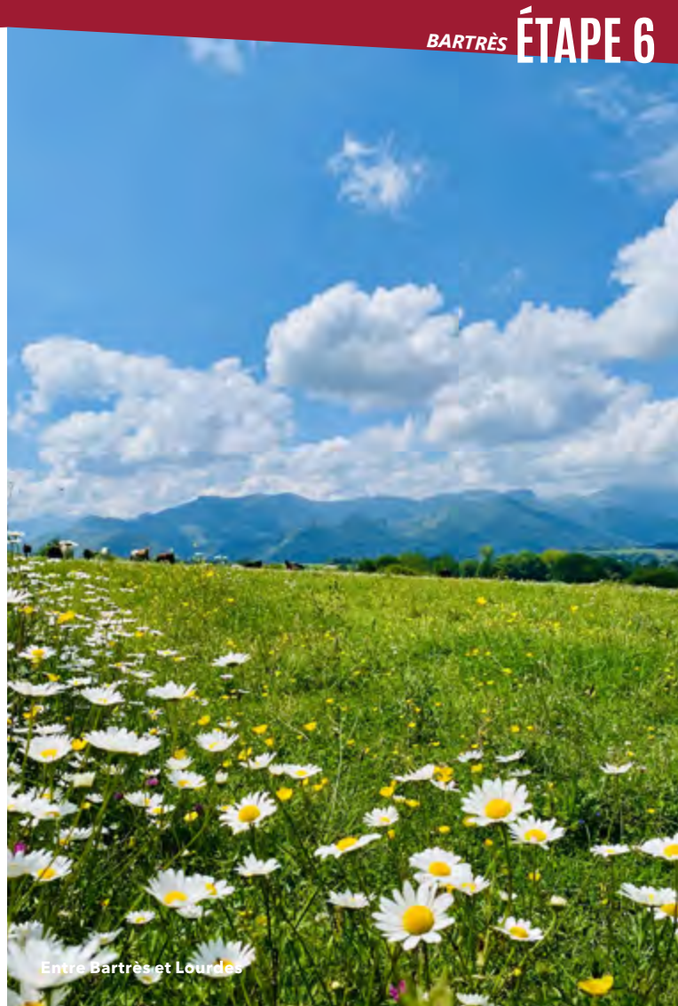
Entre bartès et Lourdes