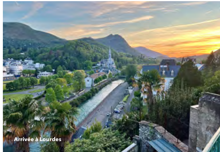
Arrivée à Lourdes

36 avenue Mal Foch Ouvert tous les jours : 7h-22h