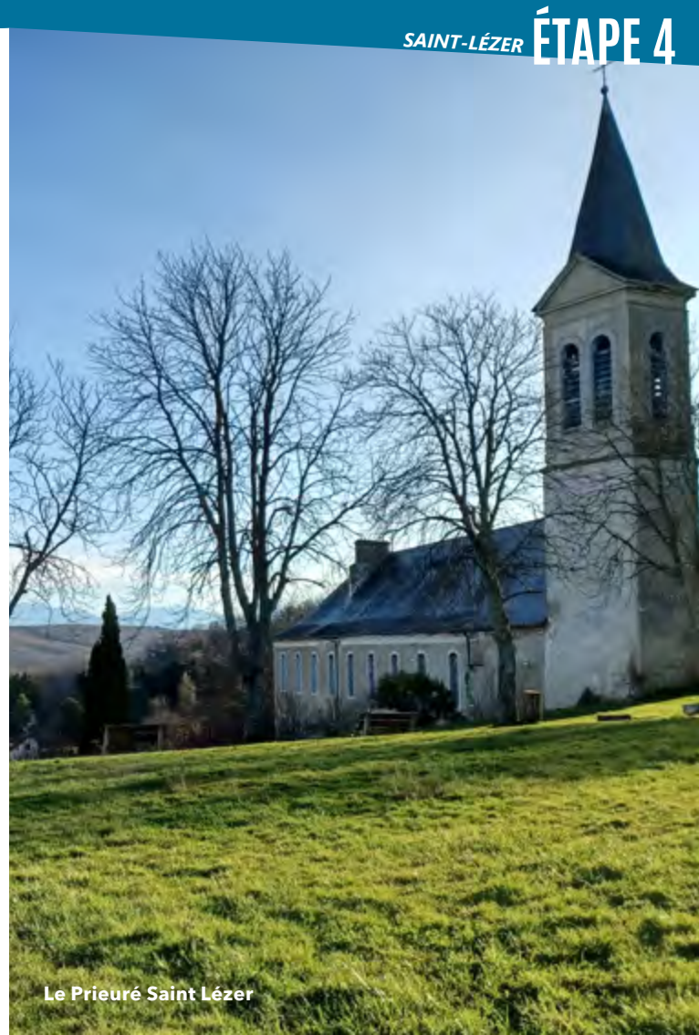
Le Prieuré Saint Lézer