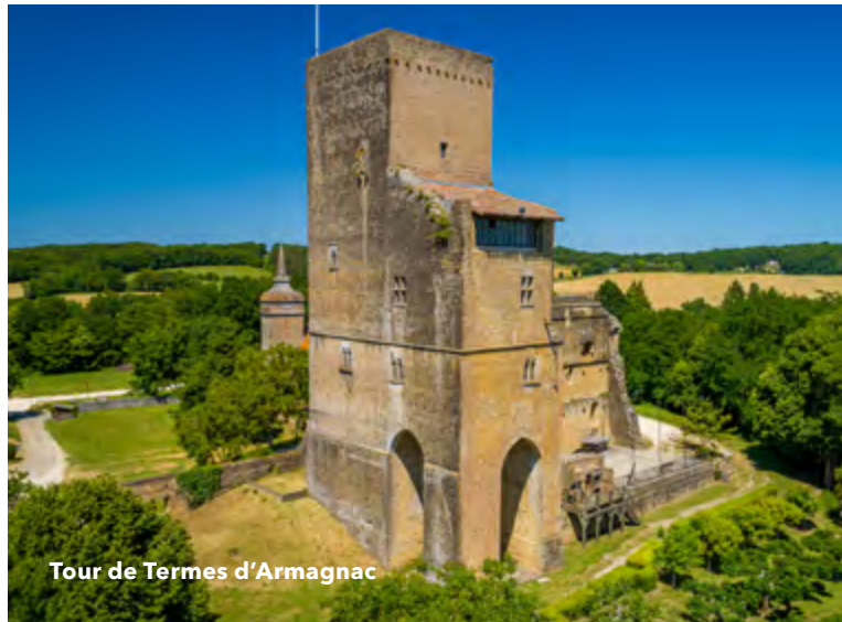
Tour de Termes d'Armagnac

Ouvert tous les jours de 7h30 à 19h Fermé les lundis et jeudis après-midi